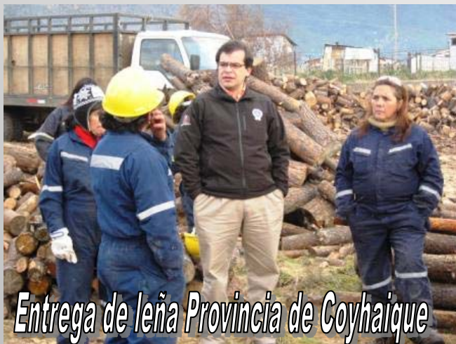
Entrega de leña Provincia de Coyhaique