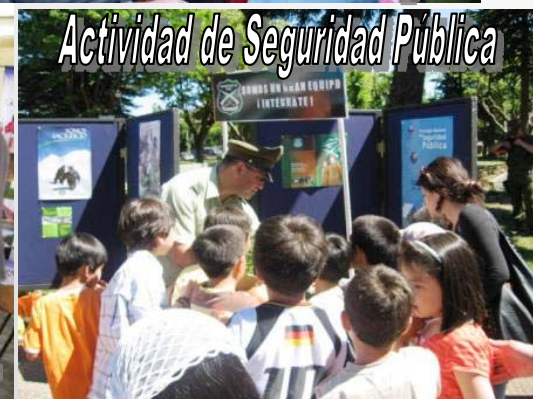
Actividad de Seguridad Pública