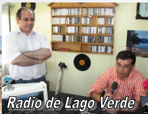
Radio de Lago Verde