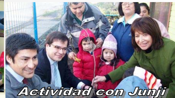
Actividad con Junji