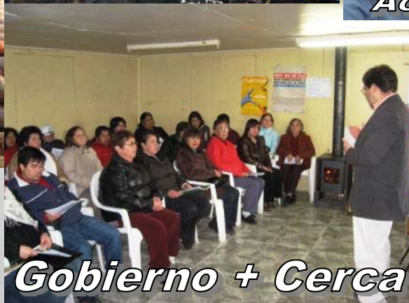
Gobierno + Cerca